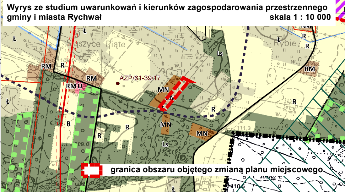
Wyrys ze studium uwarunkowań i kierunków zagospodarowania przestrzennego gminy i miasta Rybie skala 1 : 10 000

granica obszaru objętego zmianą planu miejscowego