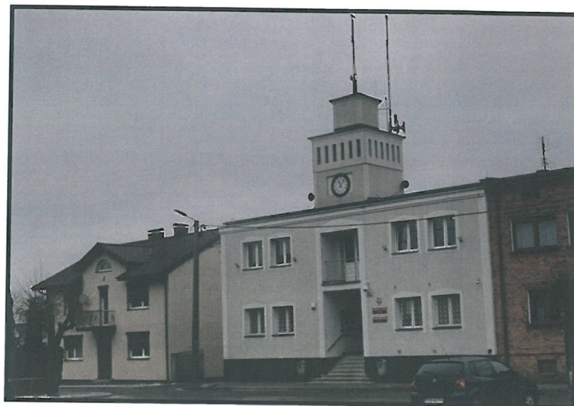
Urząd Gminy i Miasta w Rychnowie