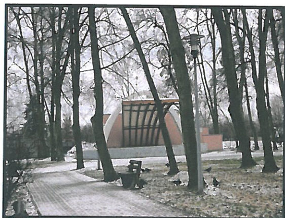
Amfiteatr – Miejski Park