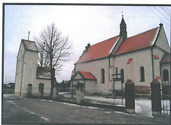
Kościół pw. Świętej Trójcy