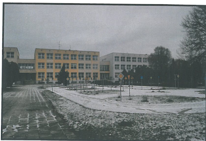
Szkoła Podstawowa wraz z miasteczkiem ruchu drogowego