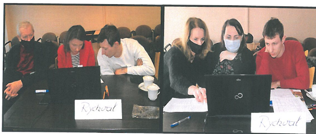
Grupa Odnowy Miejscowości w czasie warsztatów opracowania Strategii Rozwoju. Hala Widowiskowo-Sportowa w Rychwale w dniach 29-30.I.2021r.